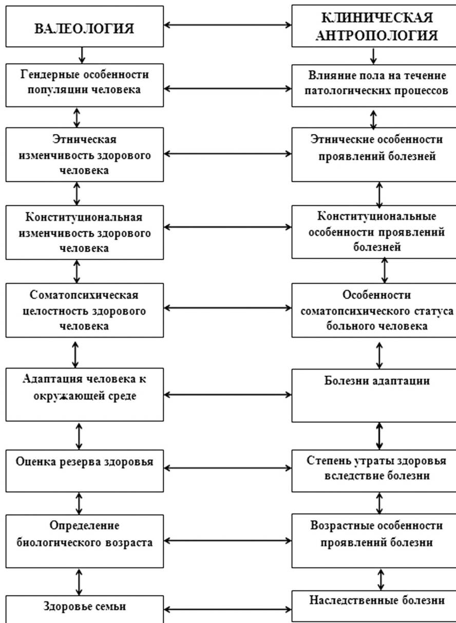
Рис. 2. Набор научных направлений биомедицинской антропологии для интеграции с классической антропологией

По данным палеогенетики в период от бронзового до железного века, Южную Сибирь населяли люди с голубыми (или зелеными) глазами, светлой кожей и рыжими волосами. В целом, количество особей с европеоидными признаками достигало 80%. Образцы ДНК, выделенные из исследуемых останков этого периода, как мужских, так и женских, относятся к гаплогруппе R1a-M17, как и у ранних индоевропейцев. Последующие волны миграции народов в этот регион, вначале монголоидов с востока, а затем славян с запада, могли изменить наши представления о генеалогии современного населения южных регионов Средней